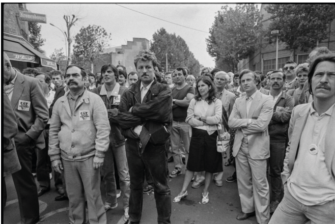
Des ouvriers de la Régie Renault de Boulogne-Billancourt manifestent le 8 août 1986 devant le siège de l'entreprise contre les mesures de licenciement annoncées.