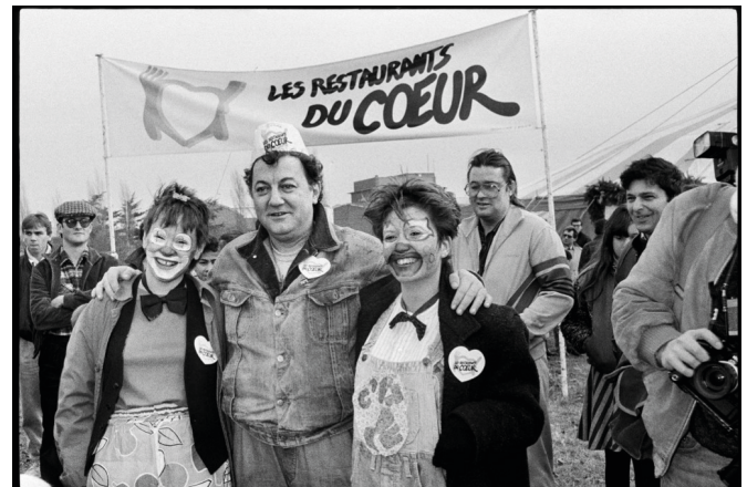
Coluche pose avec deux bénévoles devant l'entrée du Restaurant du Cœur à Gennevilliers pour l'inauguration d'un des trois Restaurants du Cœur de la région parisienne, le 21 décembre 1985.