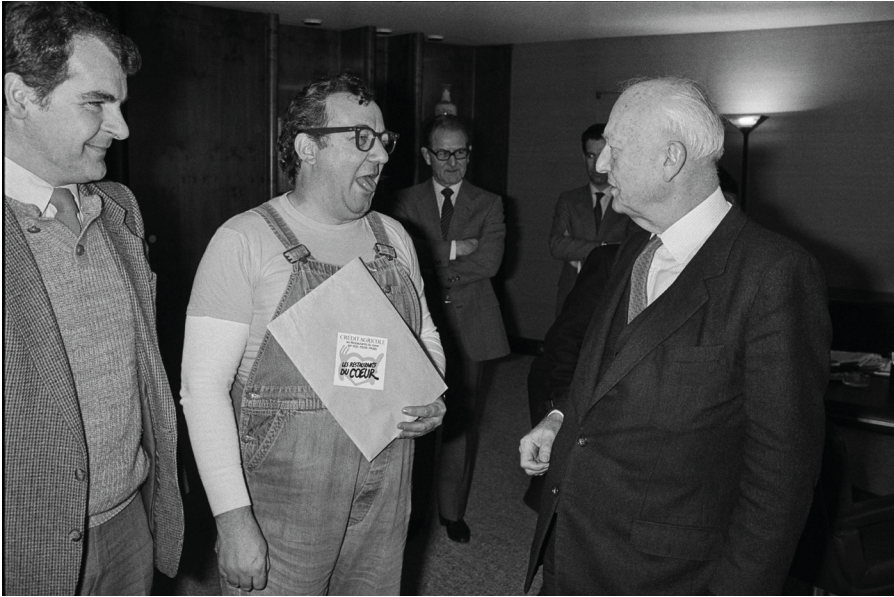
Le 20 février 1986, Coluche se rend au Parlement européen à Strasbourg pour plaider la cause des Restaurants du Cœur auprès notamment de Pierre Pflimlin, président du Parlement.