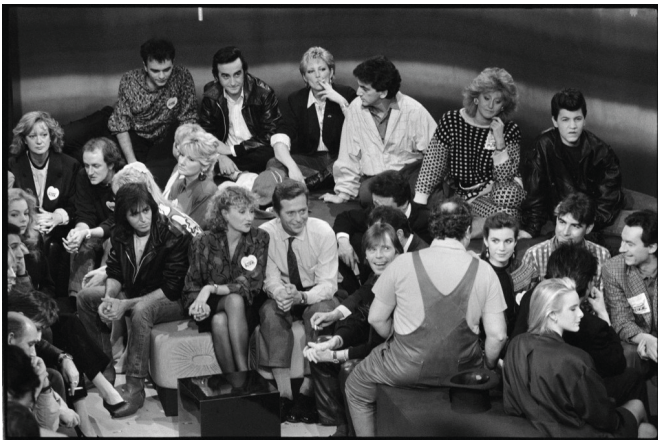
De nombreuses personnalités participent à l'émission télévisée de TF1 pour les Restaurants du Cœur organisée par son fondateur Coluche (de dos), à Paris le 26 janvier 1986.