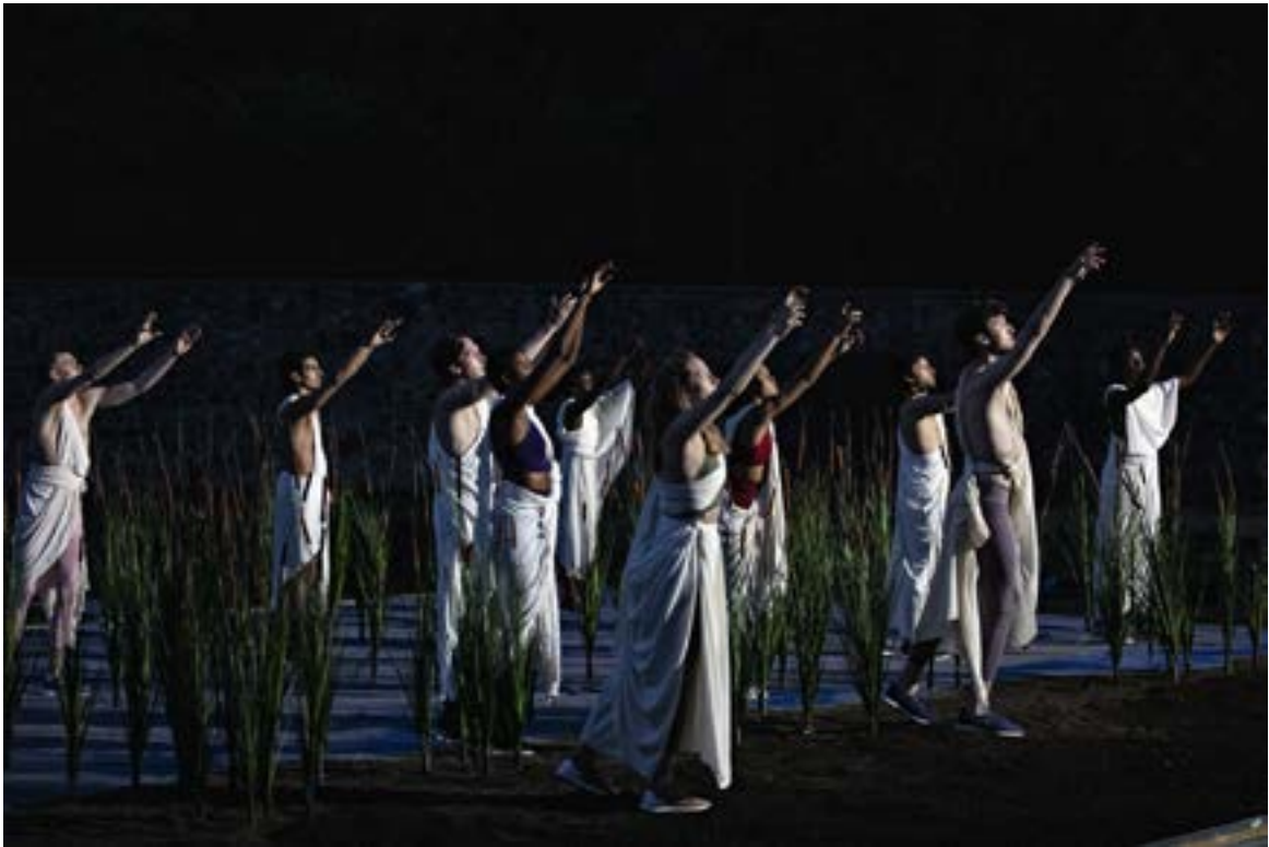
Montpellier - mai 2019

Pour écrire Mont Vérité , l'auteur et metteur en scène Pascal Rambert s'est inspiré d'une communauté utopiste qui s'est installée au début du XX e siècle à Ascona, en Suisse, au bord du Lac Majeur. Au fil du temps, de nombreux artistes et intellectuels les ont rejoints, séduits par ce mode de vie alternatif où danses, discussions, concerts, naturisme, baignades, jardinage, rythmaient les journées. Mais la Première Guerre mondiale a éclaté. Avec la complicité du chorégraphe Rachid Ouramdane, l'auteur imagine ici un groupe d'acteurs qui, au travers de cette histoire et de la leur, questionne ce que peut-être une utopie aujourd'hui.