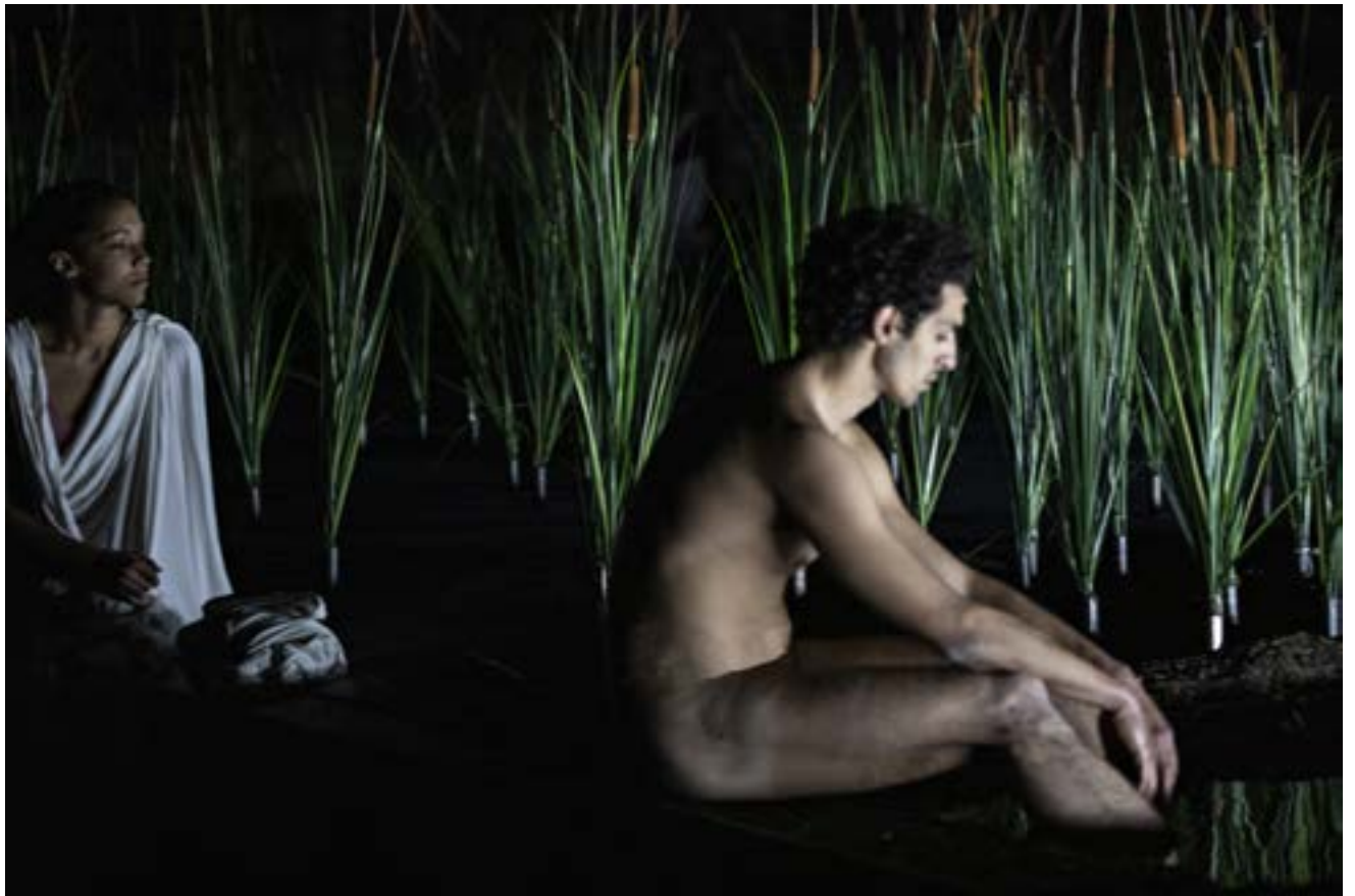
Montpellier - mai 2019