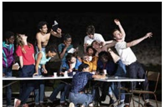
Montpellier - mai 2019 © Jean-Louis Fernandez